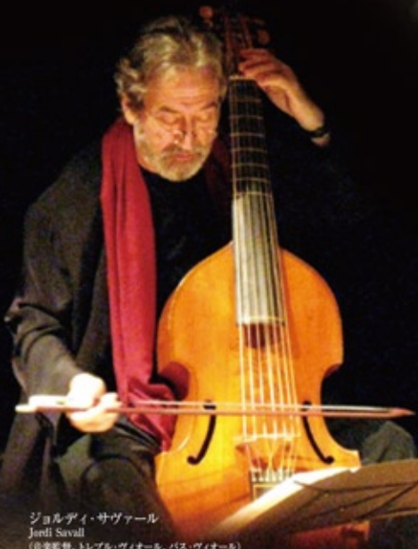
ジョルディ・サヴァール Jordi Savall (音楽監督、トロンボーン・ヴィオール、バス・ヴィオール)